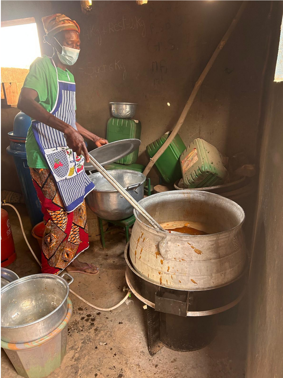
Figura 3: preparazione del pranzo con le derrate e il materiale fornito dal progetto “Nutrire la città” a Polesgo, scuola target del progetto