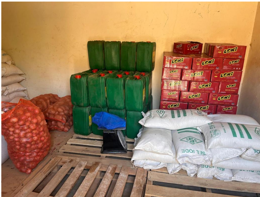
Figura 1: derrate alimentari distribuite nella scuola di Tanghin, target del progetto "Nutrire la città"