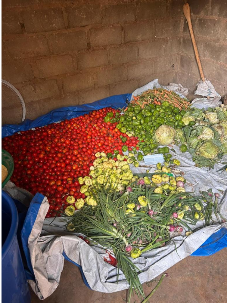
Figura 2: verdure distribuite a Karpala, scuola target del progetto “Nutrire la città”